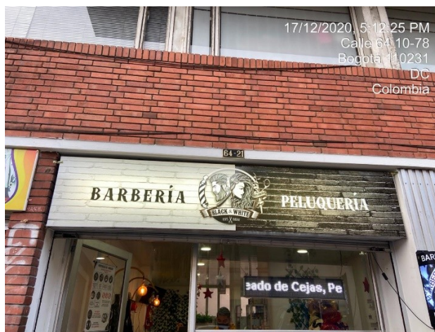
Fachada del establecimiento